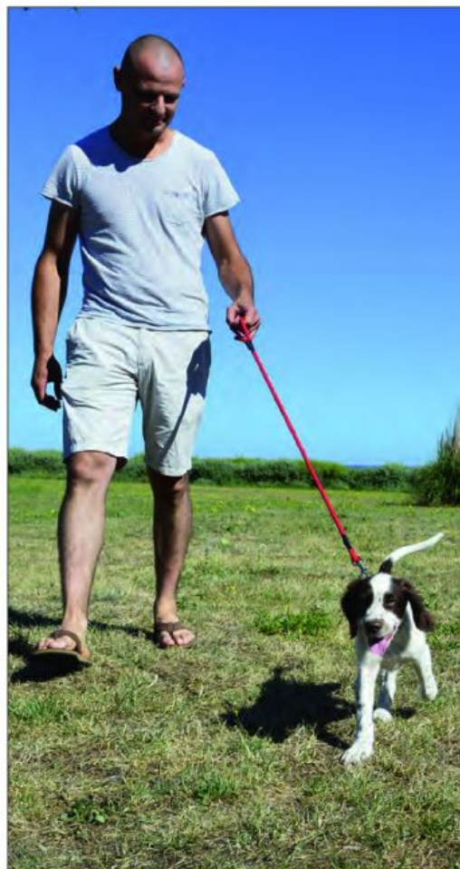
Première expérience de la marche en laisse, une phase à ne pas négliger.

recommandé d'attendre d'avoir parfaitement sociabilisé et commencé à dresser un premier sujet jusqu'à son adolescence avant d'accueillir le second élève. Selon nombre de spécialistes, deux chiots ensemble doublent rarement les plaisirs mais assurément les problèmes.